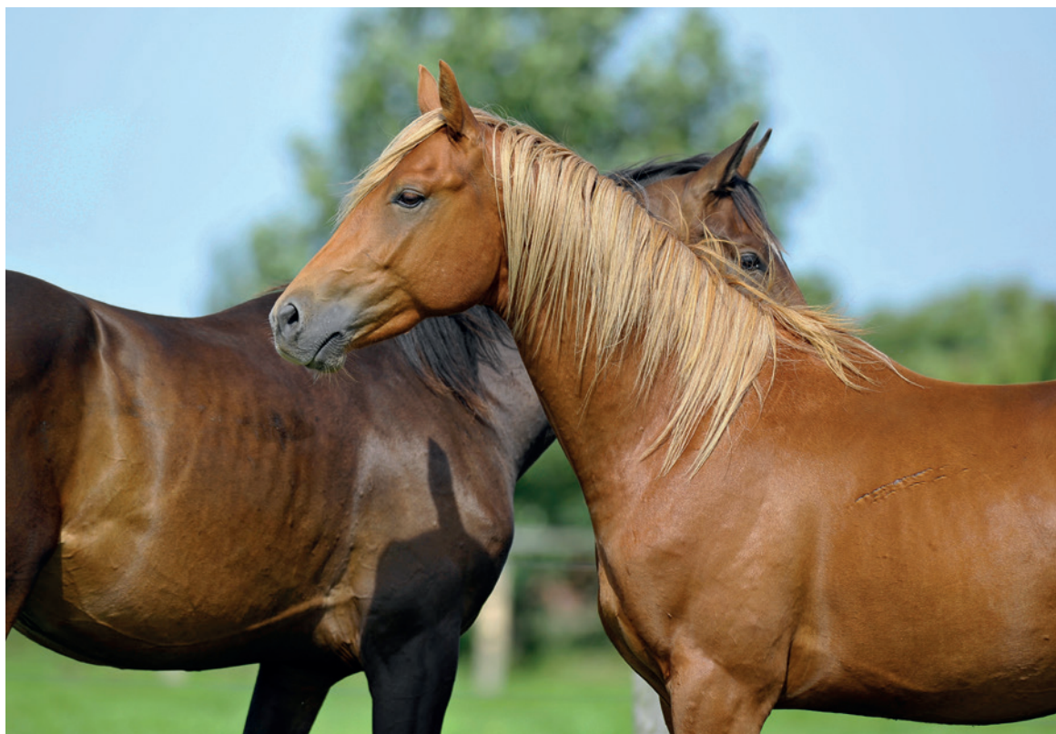
Dvouapůlletí koně na pastvině.

Často do výcvikové stáje přicházejí k obsednutí koně z pastviny. U takových koní věnujeme zvláštní pozornost krmení. Koně přicházející z pastviny by měli ze začátku dostat přibližně 1,5