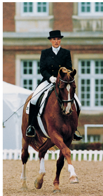
... až k těžkým úlohám!