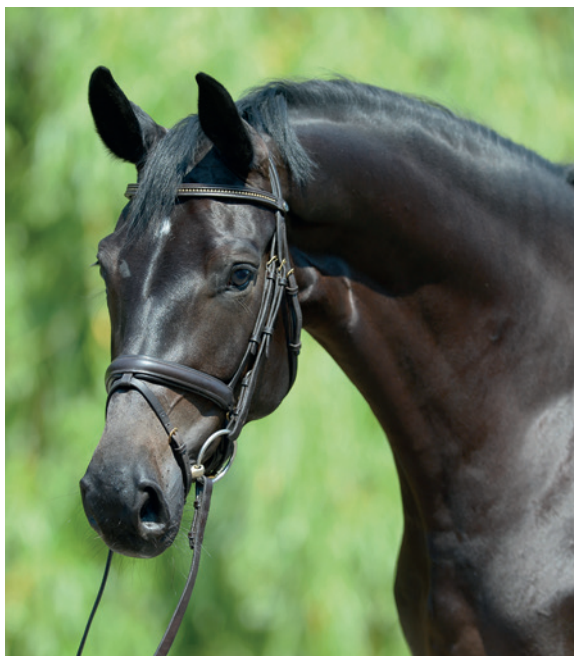
Suverénní a klidný.