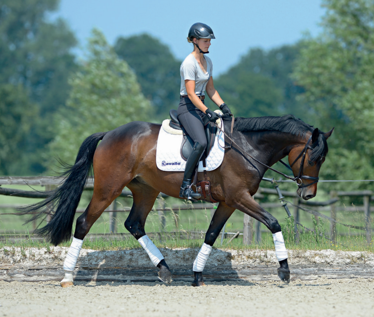
Čtyřlétý kůň pracující s dlouhým krkem.

Cílem základního výcviku mladého koně je připravit mladého, neobsednutého nebo čerstvě obsednutého koně systematickým tréninkem tak, aby získal dobrý základ pro své pozdější zaměření. Tato příprava se však nesmí omezit pouze na podporování jedné z vloh koně, spíše je důležité přirozené schopnosti koně rozsáhle rozvíjet. Základním výcvikem chceme dosáhnout toho, aby mladý jezdecký kůň (i pod neobvyklou zátěží hřbetu jezdce) znovu našel svůj přirozený pohyb a začal se pohybovat v takovém držení těla, které dovolí rozvíjet jeho další schopnosti.