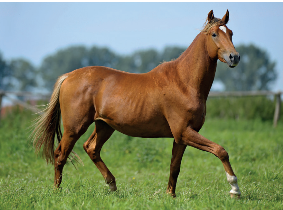
Na pastvině se může mladý kůň volně pohybovat celý den.