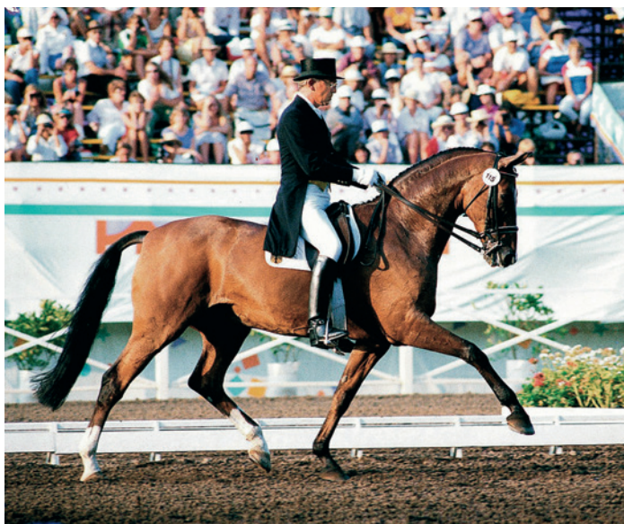
Ablerich, vítěz olympiády 1984 v Los Angeles.