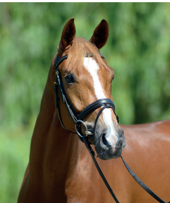
Zvědavé objevování světa.

Neklidné oko koně signalizuje bojácnost, což však není při změně stále nic neobvyklého. Znamená to, že se prozatím neupevnila důvěra v nového člověka a nové prostředí. Pokud ovšem neklidný pohled i přes dobré zacházení a péči přetrvává, měli bychom mít o koně starost – vystrašené oko totiž může být také známkou vnitřního neklidu nebo bolesti. V takovém případě je na místě zavolat veterináře.