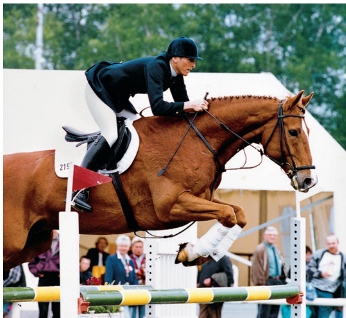
Patriot von Palast, všestranně vycvičený...