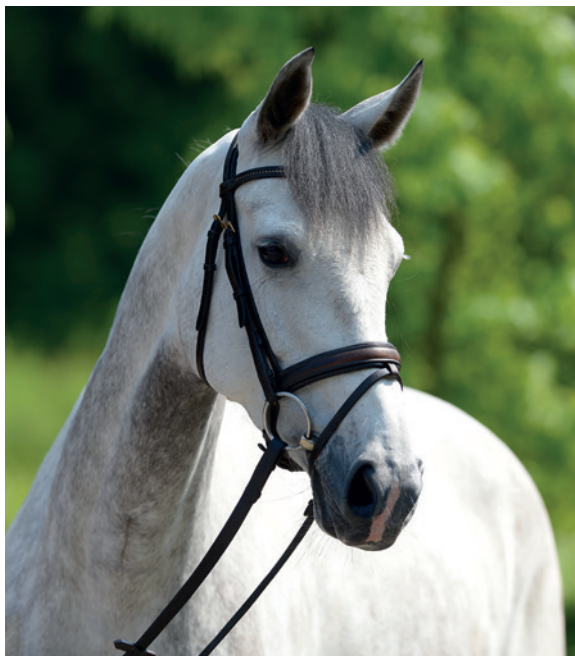
Na všechno připraven.