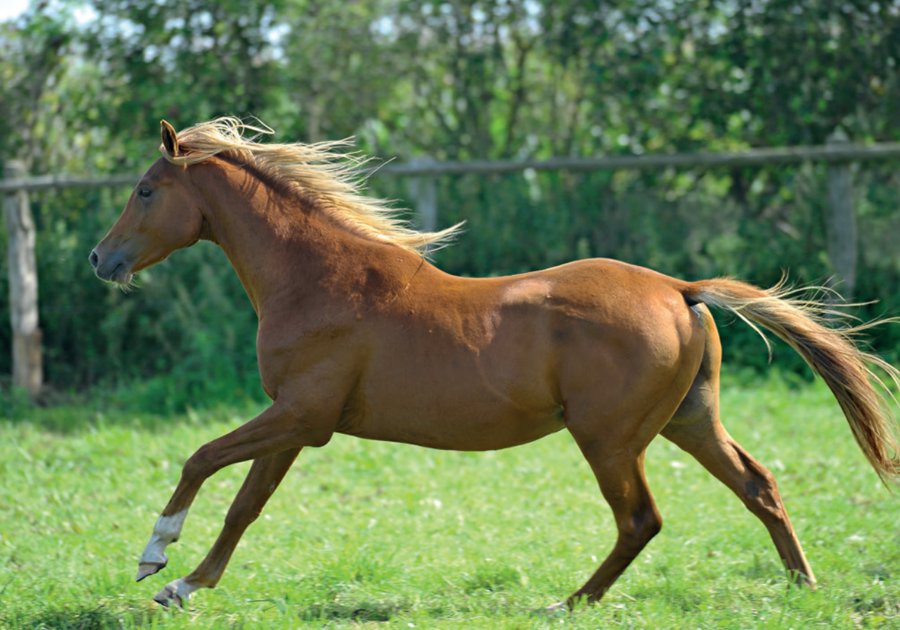
Radostný cval na čerstvém vzduchu.

Mladému koni, který přišel z pastviny do stáje, samozřejmě není možné dopřát takové množství pohybu, jakého se mu dostávalo na pastvině, kde trávil celé dny a noci. Samozřejmostí pro takového koně ale je, že chodí denně na pastvinu nebo do výběhu. Kromě toho musíme koně navíc na hodinu denně zaměstnat. Nejlépe tento čas rozdělíme přibližně na půl hodiny ráno a půl hodiny odpoledne. V prvních týdnech můžeme tento úkol přenechat ošetřovateli a sami se zhostit role pozorovatele. Kůň si tak snadněji zvykne na svého stálého ošetřovatele. Ten by ho měl dopoledne nechat přibližně čtvrt hodiny volně se proběhnout, aniž by ho naháněl nebo pobízel. Odpoledne by jej měl vzít nejlépe na uzdečce na ruce projít, aby si kůň zvykal na procházky v okolí stáje. Současně s tím, pokud na to nebyl naučený již jako hříbě, by si měl zvyknout na ošetřování, jako je vybírání z kopyt, čištění nebo umývání nohou či kopyt. Přitom je důležité přistupovat ke koni klidně, ale rozhodně, tak jak bylo popsáno v části o výchově hříběte. Zkušený ošetřovatel na koně promlouvá klidným hlasem a jako doplnění k požadavkům používá několik krátkých slov jako „Pojď!“, „Stůj!“, „Nohu!“, „Hodný!“ atd.