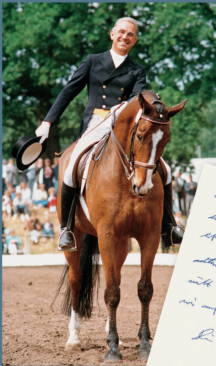
Dr. Reiner Klimke na koni Ablerich.

S tímto věnováním mi otec daroval první exemplář knihy „Základní výcvik mladého koně“.