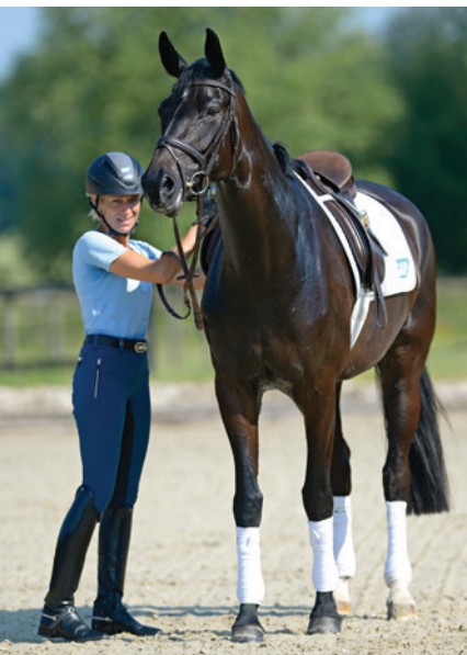
Napřímené uši, bdělý pohled.

Koně, kteří během ježdění často ocasem švihají, jsou v napětí. Takové koně bychom neměli začít jezdit příliš brzy s ostruhami, naopak k nim musíme být velmi citliví. Od začátku bychom měli dbát zejména na uvolněnost hřbetu.