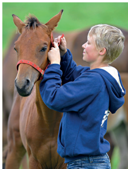
Co se v mládí naučíš, ve stáří jako když najdeš!

Pokud se nechá hříbě takto krátce přidršet, přejdeme k přikládání padnoucí (ne příliš velké) ohlávky, nejlépe takové, kterou zapínáme za týlem. Taková ohlávka má tu výhodu, že se nemusíme dotýkat velmi citlivé části těla koně – uší. Nakonec hříbě výrazně pochválíme. To by mělo pro začátek stačit. Až se pro hříbě ohlávka stane samozřejmostí, můžeme začít s jeho voděním.