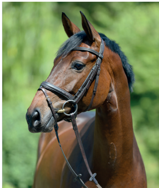
Pozorný na všechny strany.