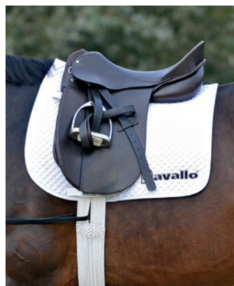
Sedlo musí být upravené na tělo daného koně.

Pro první ježdění na mladém koni používáme všestranné sedlo. Až později volíme speciální sedla určená pro drezuru a parkur. Sedlo musí být kvalitně vyrobené a dobře koni padnout, aby byla váha jezdce rovnoměrně rozložena a nikde nevznikaly otlaky. Jezdec musí v sedle správně sedět a musí být schopný správně na koně působit. Sedlo také musí při pozdějším vyседání dovolit jít s pohybem uvolněného hřbetu koně. Zaručeně se vyplatí poradit se se sedlářem a sedlo zakoupit až ve chvíli, kdy koni sedí bez jakýchkoli podložek. Pokud šetříme na sedle, šetříme na nesprávném místě.