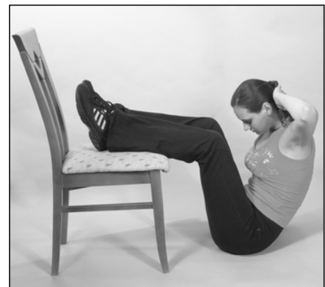
Obr. 23 Zvedáme se ke kolenům